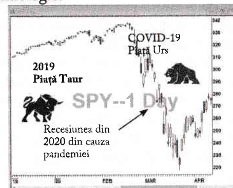
Figura 1.2 – Comparatie între piața în creștere din 2019 și piața în scădere din 2020, după cum arată modificarea valorii acțiunilor a 500 dintre cele mai mari companii americane. Aceste companii sunt urmărite de S&P 500

Cea mai interesantă observație din figura de mai sus mi se pare a fi aceea că, pe măsură ce piața bursieră s-a prăbușit, iar scăderea acesteia a ajuns la știri, oamenii au dorit să afle mai multe despre piața bursieră. Această corelație este, de fapt, vizibilă în aproape toate prăbușirile anterioare ale pieței bursiere, inclusiv criza financiară din 2007/2008 și bula dot-com din 2000, aceasta din urmă fiind momentul în care s-a spart balonul prețurilor exagerate și mai ales supraevaluate ale majorității companiilor cu activități legate de internet și de tehnologie.